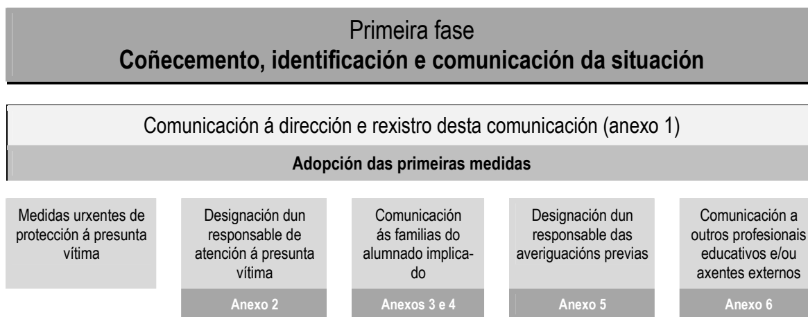
Cadro 1. Esquema da primeira fase do protocolo.

De apreciarse indicios de delito ou falta penal en calquera momento do proceso, notificarase ao ministerio fiscal e aos servizos de protección de menores (con traslado á administración educativa) para a súa valoración. No caso de iniciarse un proceso penal, o centro suspenderá as actuacións en tanto este non se resolva.